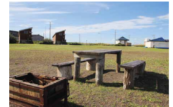
サイト内の数箇所にテーブルとバーベキューコンロが設置