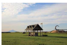
遠別川河川公園キャンプ場