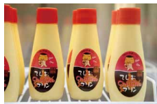
チューチュープリン