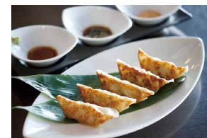
羽幌えびタコ焼き餃子