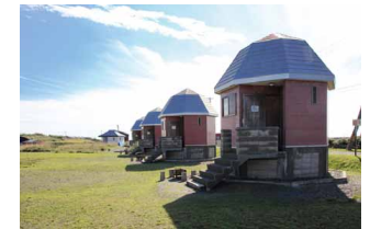
フリーサイトにはバンガロー(4人用)8棟