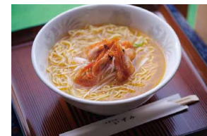
羽幌えびしおラーメン