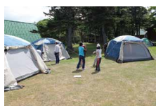
富士見ヶ丘公園キャンプ場