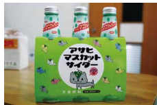
マスカットサイダー